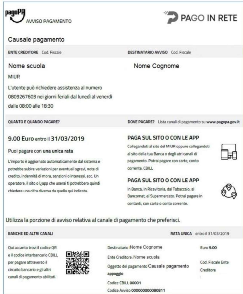
Figura 1 - prima pagina