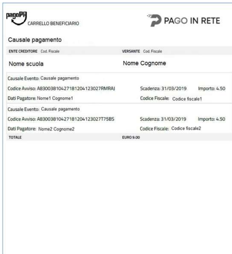
Figura 2: seconda pagina

La commissione applicata dal PSP se richiesta, per il pagamento a favore del beneficiario sarà solo una, a prescindere dal numero di avvisi che l'utente ha inclusi nel pagamento.